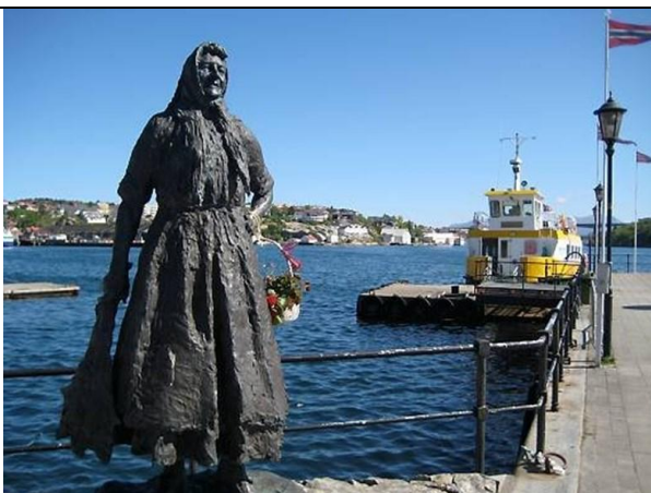
Klippfiskjerringa und Sundboot im Hafen

Archhäologische Ausgrabungen bewiesen daß Kristiansund schon vor 8000 Jahren als Hafen benutzt wurde. Ab dem Jahre 1742 wurde sie Kaufmannsstadt mit Haupterwerb aus dem Export von Trochenfisch (Klippfisk), der vor Orte zubereitet wurde.